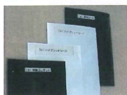
すべり材シート式