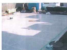
上部すべり材敷設