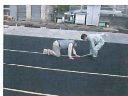
目地粘着テープ固定