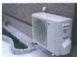
空調室外機設置状況