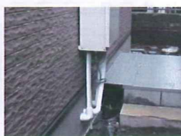
湯沸し器設置状況