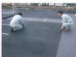
保護ゴムマット敷設