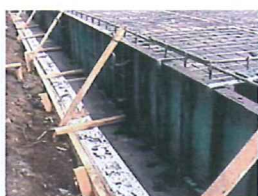
立上がり型枠固定