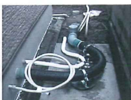
フレキシブル配管