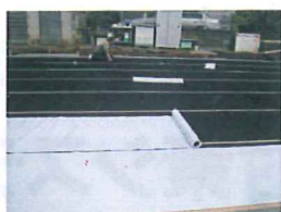
下部すべり材敷設