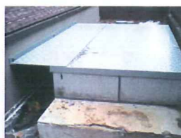
縞鋼板の配管カバー