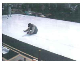
目地フッ素樹脂テープ固定