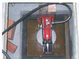
ジャッキによる原点復帰 (オプション)