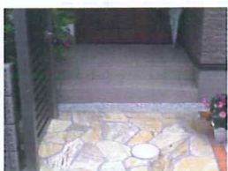
ポーチの可動部処理